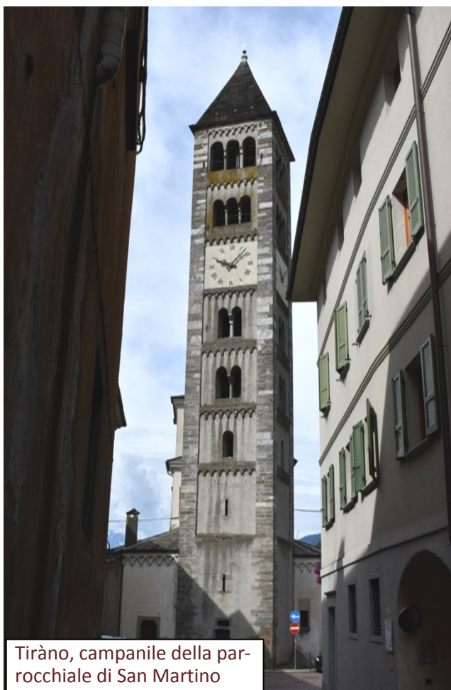
Tiràno, campanile della parrocchiale di San Martino

In modo pressoché analogo, a Tiràno fu udito il suono della campana grande di San Martino. Il Pretore mandò i suoi famigli a informarsi, e si seppe che l'accaduto non era opera d'uomo. Poco dopo anche la campana del Pretorio fu udita suonare, ma la causa non fu trovata.