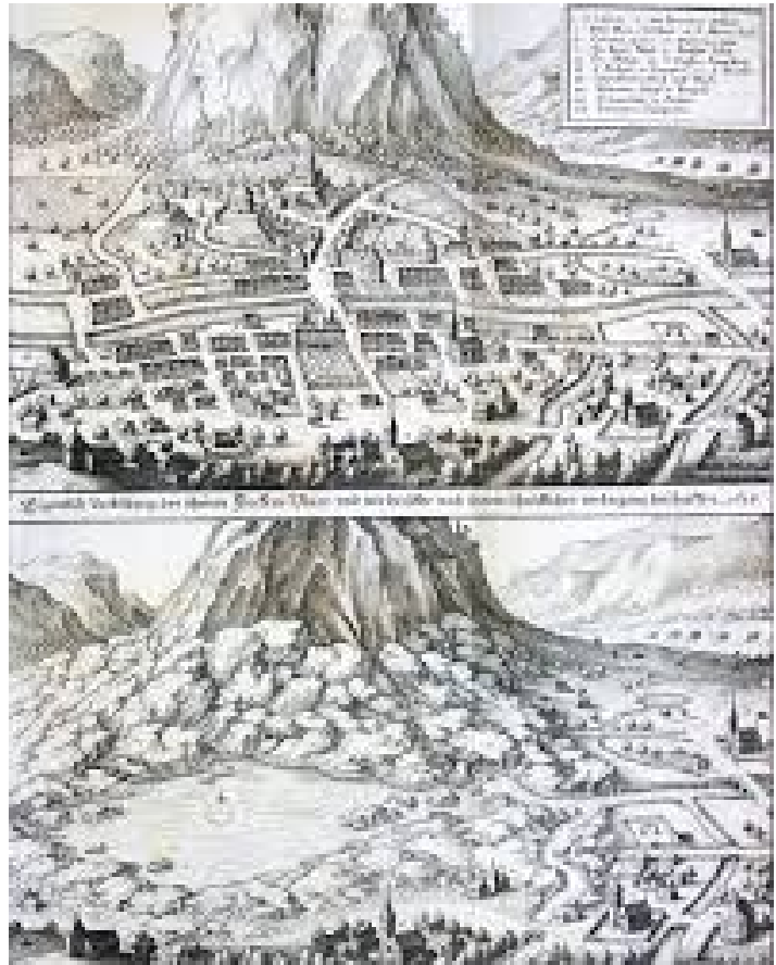
Piuro prima e dopo la frana (disegno del XVII sec.)

E se non piangi, di che pianger suoli?» (Cesare Cantù)