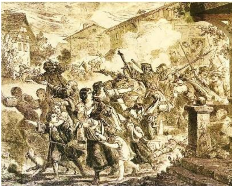
stampa secentesca: Il Sacro Macello di Valtellina