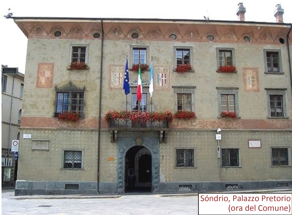
Sóndrìo, Palazzo Pretorio (ora del Comune)