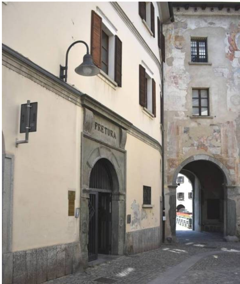
Tirano: Pretura e Porta Poschiavina