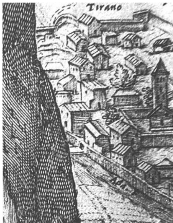
Scorcio di Tiràno in una stampa del '600: sulla destra la parrocchiale di San Martino e il muro delimitante l'area consacrata (il sagrato).

Era sopraggiunto anche il sacrestano della chiesa riformata che, riconosciuto, fu colpito a morte. Io, che gli ero vicino, lo invitai a convertirsi, ma lui disse soltanto: «Ahimè, muoio», e spirò. Presero allora il corpo per una gamba e lo trascinarono fuori dal cimitero consacrato.