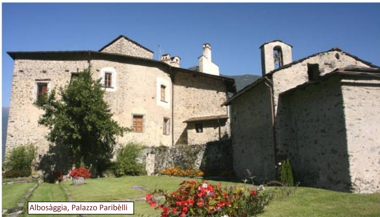
Albosàggia, Palazzo Paribelli

A Boffètto, la truppa di fondovalle, condotta da Prospero Quàdrìo, incontrò cinque giovani Tellini, protestanti, che tornavano dal presidio di Morbégnò; in pochi attimi i cinque furono trucidati. Neppure la squadra alta, guidata dallo stesso Guicciàrdi, passava senza colpire: a Montagna furono uccisi sei riformati: tre locali, due Poschiavini e un Bregagliotto.