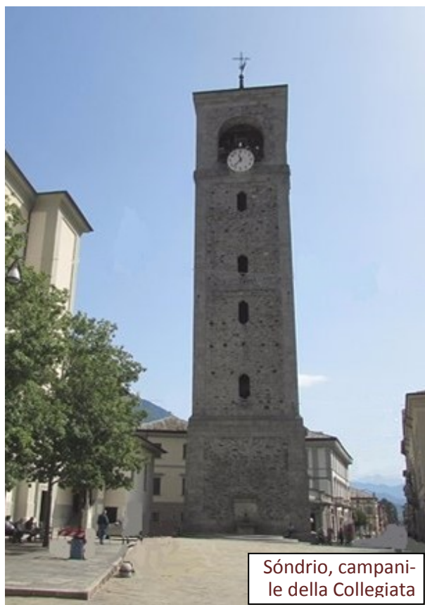
Sóndrìo, campanile della Collegiata

Da prodigi grandi e misteriosi fu annunciato l'evento straordinario e terribile della strage. A seguito di informazioni su possibili iniziative spagnole, nella primavera del 1620 i governanti retici posero sentinelle sui campanili di tutti i paesi della valle, affinché gli spari e lo scampanio dessero prontamente l'allarme. A Sóndrìo, la mattina dell'8 di maggio, le due guardie, cattoliche, riferirono al podestà che durante la notte avevano udito un forte mormorio provenire dalla chiesa dei Santi Gervasio e Protasio, seguito da una luce diffusasi anche nel campanile. Quando i due entrarono in chiesa, la luce si spense, ma subito i contrappesi dell'orologio, scossi da mano non umana, caddero al suolo. Durante la giornata, poi, il suono della campana maggiore, quella dell'allarme, per tre volte fu udito da tutti. Le due sentinelle morirono pochi giorni dopo: secondo i più, di angoscia o di terrore.