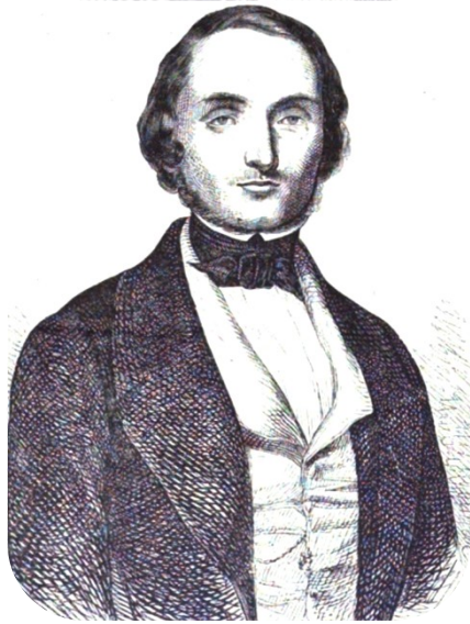
Cesare Cantù (1804-95)

È difficile scorgere una qualche differenza tra le motivazioni dei congiurati del 1620 e l'incitamento che, ben cinque secoli prima, san Bernardo di Chiaravalle rivolgeva ai crociati: «Il Cavaliere di Cristo uccide in piena coscienza e muore tranquillo: morendo, si salva; uccidendo, lavora per il Cristo». Né va dimenticato che, per le guerre chiamate crociate, la parola d'ordine era: «Dio lo vuole!»