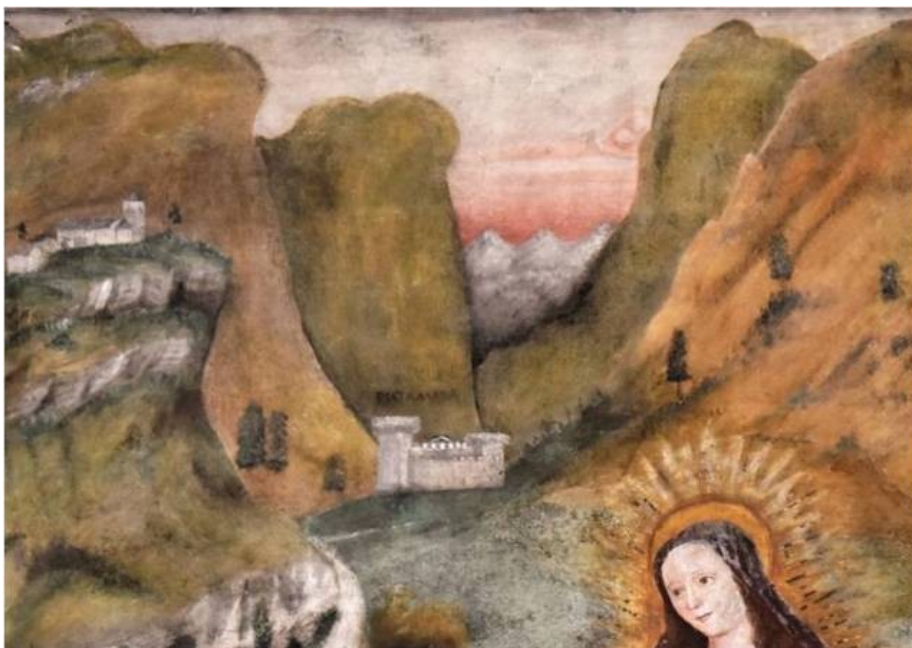
Madonna di Tiràno, Santuario: Affresco della Apparizione (1513), particolare: S. Perpetua, il castello di Piattamàla, ingresso alla Valposchiàvo

Certi che non pochi Tiranesi vedevano le fiamme, gli incendiari commentarono soddisfatti: «È il falò che celebra il ritorno alla vera fede!»