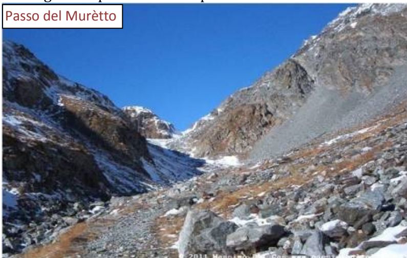
Passo del Murètto