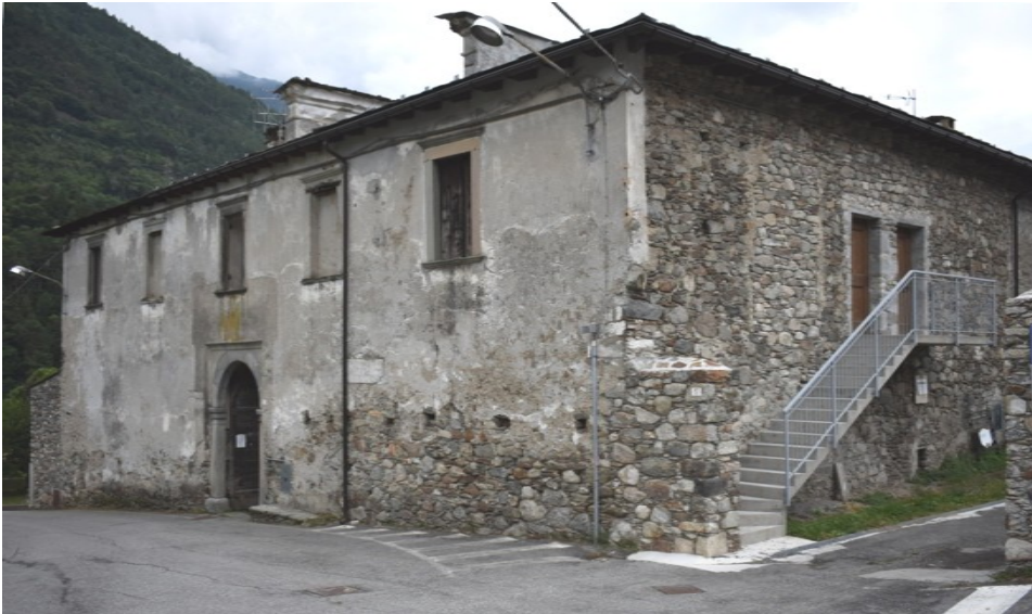
"La Guicciàrda", villa di campagna realizzata da Giovanni Guicciàrdi a Ponte in Valtellina, fraz. Casàcce