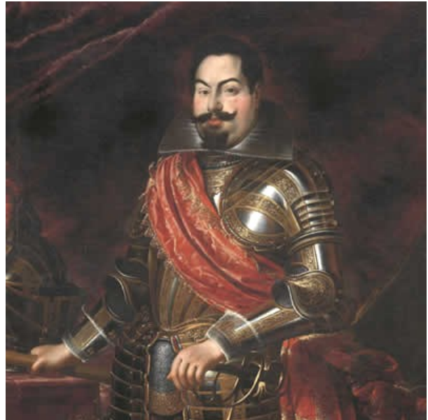
Gómez Suárez de Figueroa y Córdoba Duca di Féria

FERIA «Mi onoro di essere parte di un tale progetto. Tre valori ci guidano: la reputacion , la religion , la conservacion . La reputacion della Spagna è il suo prestigio internazionale, che, a sua volta, dipende dalla religion , cioè dalla difesa leale e assoluta del cattolicesimo; compito che richiede il dispiegamento di ogni forza disponibile e dunque la conservacion di tutti i territori sui quali sventolano i vessilli di papa Paolo V e del nostro re Filippo.»