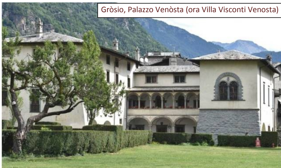
Gròsio, Palazzo Venòsta (ora Villa Visconti Venosta)