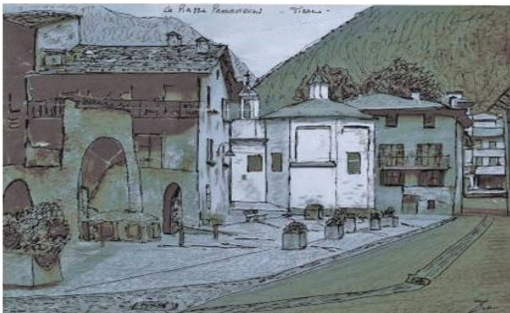
Tirano, Piazza Parravicini